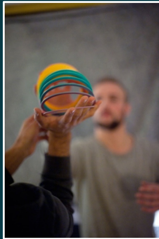
Example of a flow toy—a “spiral”—bounced back and forth between after-party participants (photo by Romy Kaa, Utrecht, December 6, 2013)